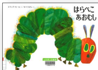
『はらぺこあおむし』